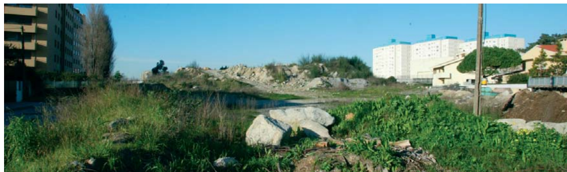
Local onde será construída a futura avenida

Texto: Marta Almeida Carvalho