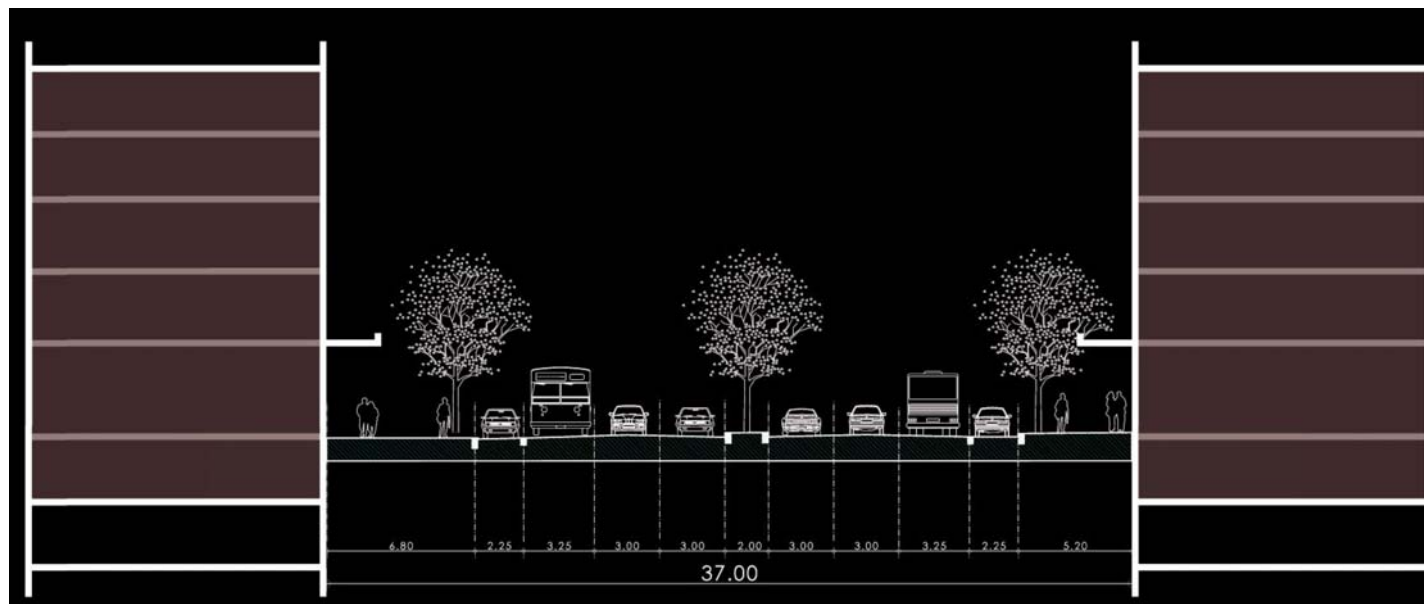
Escala ao corte